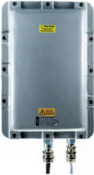
Fig. 3 Hochenergiezünder HEI600 Ex-Zone 2