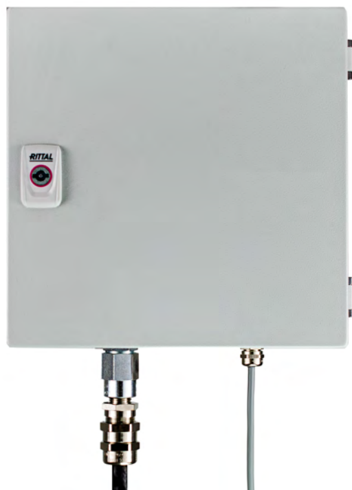
Fig. 1 Externes Stahlgehäuse für Wandmontage „Hochenergiezünder HEI600“