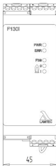
Fig. 1-2 Dimension F130I