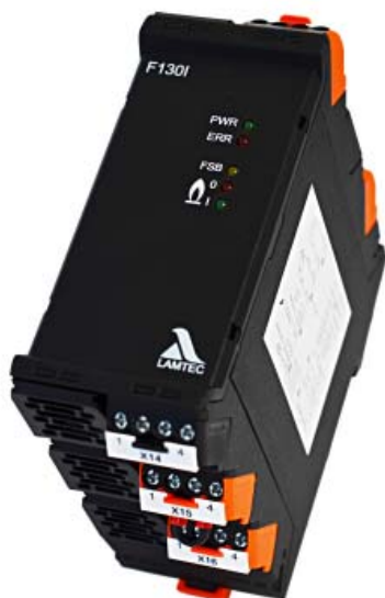
Fig. 1-1 F130I