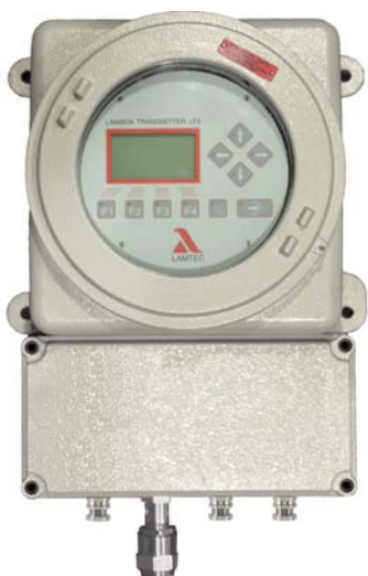
Fig. 1 Transmetteur Lambda LT3-Ex avec boîtier de raccordement