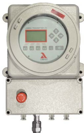
Fig. 2 Transmetteur Lambda LT3-Ex avec boîtier de raccordement et interrupteur principal