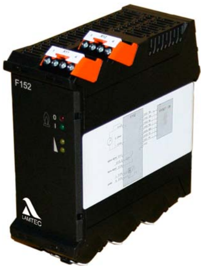
Fig. 1 F152 ...