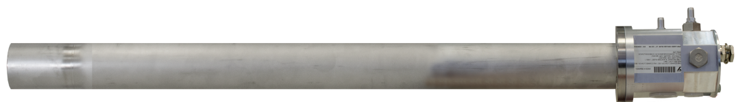
Fig. 1 Vue latérale du brûleur d'allumage GF135 modèle C