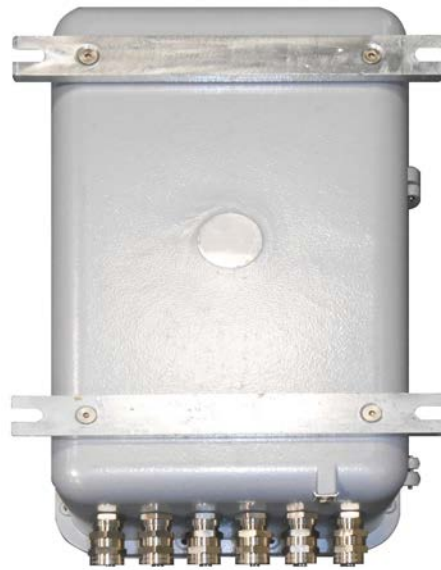
Fig. 2 Rückansicht EExd-Gehäuse