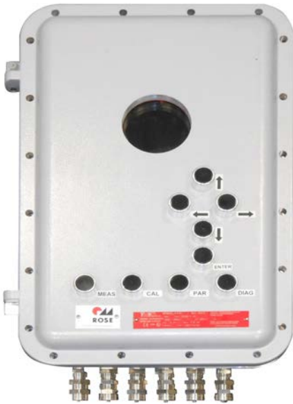
Fig. 1 EExd-Gehäuse für LT2 zur Installation innerhalb des Ex-Bereichs