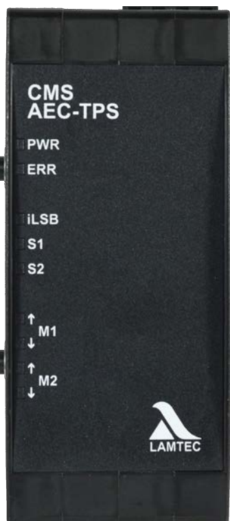
Fig. 1 Abbildung AEC-TPS