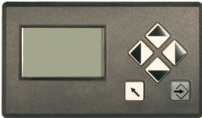
Fig. 1 Abbildung UI400