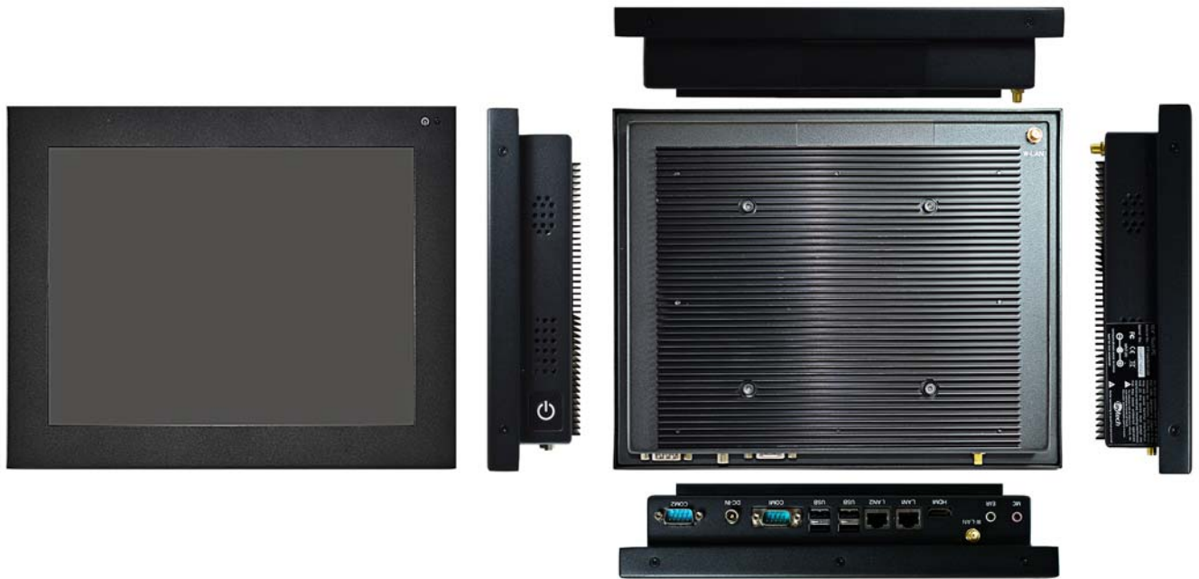
Fig. 1 Les vues GKI300