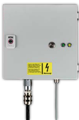
Stahlgussgehäuse mit Steuereinheit