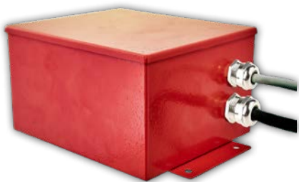
Stahl oder Stahlblech Gehäuse mit Steuereinheit