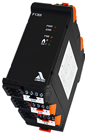
Fig. 1 F130I