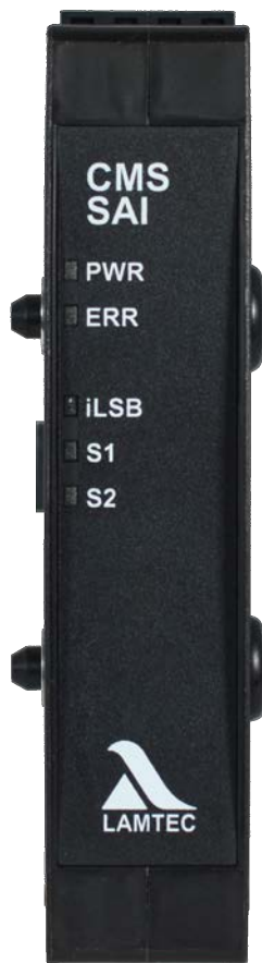
Fig. 1 Abbildung SAI