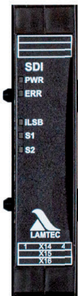
Fig. 1 Abbildung SDI