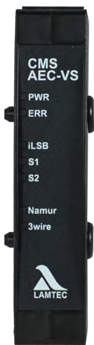
Fig. 1 Illustration AEC-VS