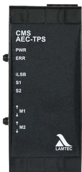
Fig. 1 Illustration AEC-TPS