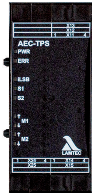
Fig. 1 Abbildung AEC-TPS