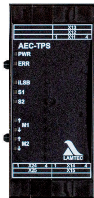
Fig. 1 Illustration AEC-TPS