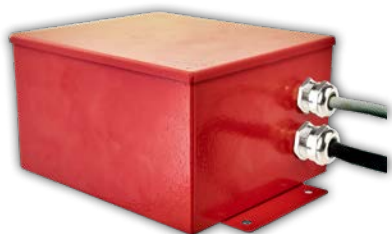
带控制单元钢制外壳