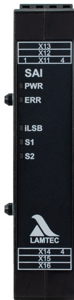
Fig. 1 Abbildung SAI