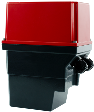
Fig. 1 Stellantrieb 60 Nm