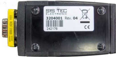
USB-CAN Modul der Revision 4 (Rev. 4)

USB-CAN Module der Revision 2 und früher werden nicht mehr von dem Treiber der Revision 5 unterstützt.