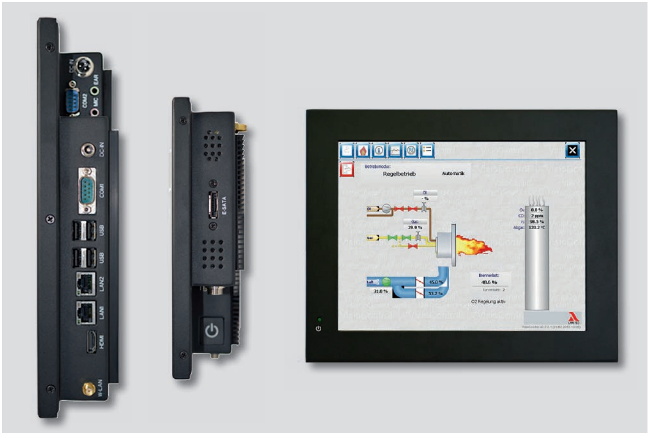
GKI300 seitliche Anschlüsse und Front.